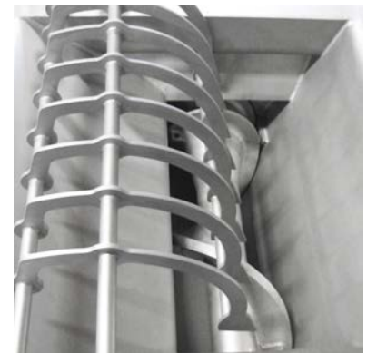
Tornillo de avance y guía para bloques sólidos